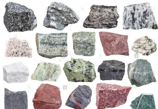
Fig. 9 Roche métamorphiques