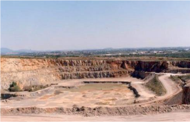
Fig. 3 Carrière en fosse

développé sur le versant et peut aussi entamer le substratum calcaire. Ce mode peut être considéré comme une variante de la carrière à flanc de coteau. Les éboulis exploités sont généralement d'origine postglaciaire et concernent un matériau meuble (Fig. 4).