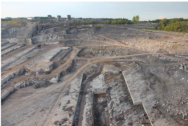
Fig. 1 Carrière de pierres à ciel ouvert à Soignies, Province de Hainaut, Belgique.

Une carrière est le lieu d'où sont extraits des matériaux de construction tels que la pierre, le sable ou différents minéraux non métalliques ou carbonifères. Le chantier se fait à ciel ouvert (Fig. 1). Les carrières peuvent être souterraines ou sous-marines. Elles exploitent des roches meubles (éboulis, alluvionnaires) ou massives (roches consolidées sédimentaire (calcaires et grès), éruptive ou métamorphique (ardoises, granites, porphyres, gneiss, amphibolites, quartzites, schistes, basaltes, etc.).