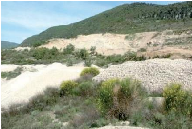
Fig. 4 Carrière d'éboulis