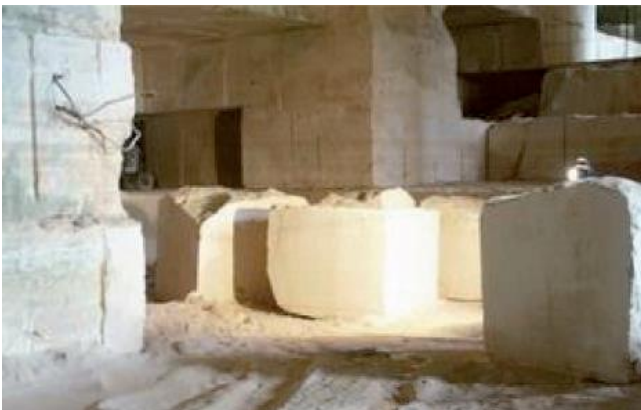
Fig. 5 Carrière souterraine