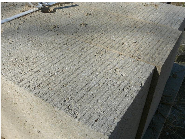
Fig. 7 Blocs de calcaire bruts de sciage de carrière

Les calcaires sont des roches carbonatées : leur formule chimique est à base de carbonates de calcium ( \text{CaCO}_3 ), mais aussi de carbonate de magnésium ( \text{MgCO}_3 ). D'autres roches carbonatées lui sont associées dans la présente étude, comme les craies, formées d'accumulation de tests coquilliers d'organismes microscopiques, et les dolomies. Ces roches sont essentiellement d'origine marine. Elles proviennent d'une accumulation d'éléments détritiques, d'une activité biologique ou d'une précipitation chimique. Ces trois facteurs sont souvent combinés, ce qui contribue à la diversité des roches calcaires rencontrées.