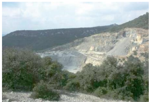
Fig. 2 Carrière à flanc de coteau

Des situations mixtes existent entre ces deux types. À partir d'une carrière à flanc de coteau, l'exploitation peut se poursuivre par abaissement du carreau (à savoir le fond de la carrière) à la manière d'une exploitation en fosse.