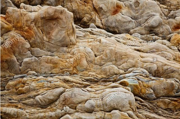
Fig. 10 Mur de roche sédimentaire