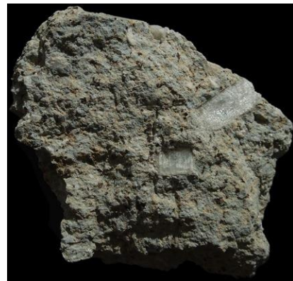
Fig. 8 Roche magmatique